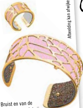
Afbeelding kan afwijken

Like de Facebookpagina van Nederland Bruist en van de glossy uit jouw regio. Share de actie met je vrienden zodat zij ook op de hoogte zijn van deze leuke lezersactie! Of stuur je gegevens o.v.v. 'Lezersactie#1 september naar prijsvraag@nederlandbruist.nl